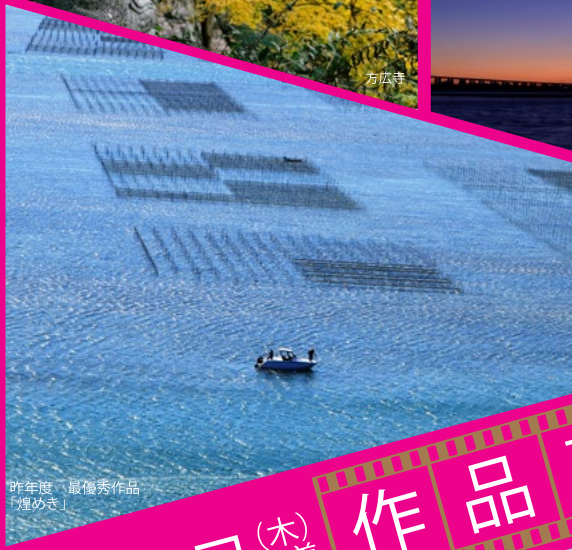
昨年度、最優秀作品「煙めき」