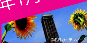
浜名湖ガーデンパーク